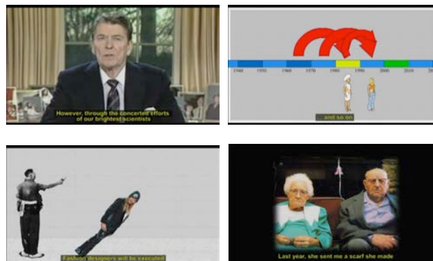
Cuatro imágenes de El fin del mundo (Alberto González Vázquez, 2010)

Se compone la obra de González Vázquez de imagen real y animación: vídeos, dibujos y fotomontajes, de color y blanco y negro 19 . La premisa es la impureza que imponen esa heterogeneidad y la voluntad de alterar la naturaleza de toda imagen o sonido, como es el caso de los filmes en los que se utiliza un sintetizador de voz para distorsionarla, y de aquéllos en los que la sola voz de Querido Antonio se esfuerza apenas en variar las modulaciones para diferenciar a los personajes. En el sonido residen precisamente muchas de las manipulaciones realizadas por Alberto González para el programa televisivo El intermedio , hilarantes piezas de actualidad a las que su autor no reconoce la misma dimensión artística que a sus cortometrajes. Estos vídeos de circunstancias son no obstante reveladores de las técnicas que constituyen la base de sus cortos, como el remontaje, el collage o el falso doblaje; gracias a ellos, por ejemplo, en El fin del mundo (2010), Ronald Reagan se convierte en apocalíptico matricida. El film fue catalogado por algunos críticos como uno de los mejores cortos de 2010; es sin duda uno de los mejores trabajos de su autor y un excelente ejemplo para ilustrar algunas de las tendencias audiovisuales más en boga.