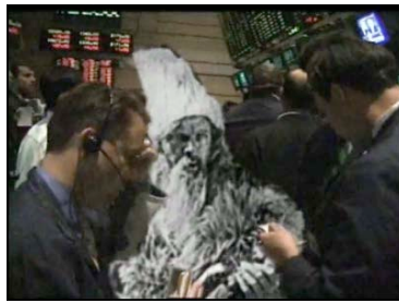
Robinsón en Wall Street ( Aislado , Gerard Freixes, 2007)

En el caso de Freixes, el paratexto colma la curiosidad del receptor aportando informaciones acerca del material utilizado. Aparecen así en los créditos de Aislado , Alone y The Homogenics los títulos de las obras recicladas y los nombres de sus autores; en el último de los cortos, el ansia de precisión lo lleva incluso a detallar el título de los diferentes capítulos de dominio público de The Dick van Dyke Show empleados, y el nombre del guionista de cada capítulo junto al del director. No necesita sin embargo el espectador llegar a esos títulos de crédito para destruir la ilusión realista que apenas ha durado unos segundos: 42, para ser precisos, lo que tarda el primer Dick van Dyke en abrir la puerta al segundo, antes de que se les unan un tercero y hasta un cuarto. Reconociendo o no el metraje apropiado, sin duda nadie puede adherirse a tal proliferación de Dick van Dyke, ni puede dejar de percibir las escasas pero perceptibles infracciones de las reglas de proporción, tamaño y perspectiva.