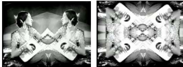
Dos imágenes de Crossing Games (Gerard Freixes, 2008)

Gerard Freixes obra de una manera radical en cortos que se sustentan únicamente en viejas imágenes televisivas y cinematográficas sobre las que ejerce una evidente manipulación 14 . En Crossing games (2008) el realizador catalán construye un acompañamiento visual a la música de Bernat Roca, a base de imágenes recuperadas del acervo hollywoodiense y que, en tanto que especulares y caleidoscópicas, recuerdan a las que inundan la obra del experimentador belga Nicolas Provost. Se inscribe este trabajo en la tradición menos crítica del apropiacionismo, la que dialoga con el centro por excelencia de la cultura popular, estilizando unas imágenes ya de por sí estilizadas, que se liberan ahora de toda tiranía narrativa y reivindican su naturaleza de objeto estético y kitsch 15 . Ese diálogo con la cultura más popular será una constante en la obra de Freixes, aunque veremos a continuación que normalmente se establece una relación más compleja entre el objeto encontrado y la pieza que se crea a partir de éste.